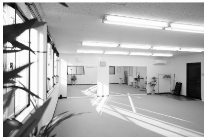
室内は明るいスタジオ風道場です