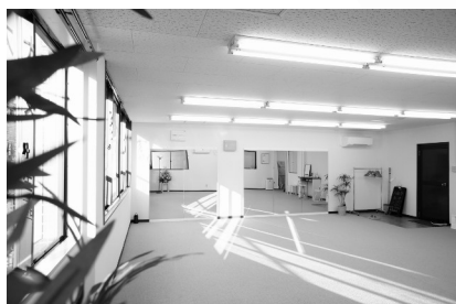
室内は明るいスタジオ風道場です